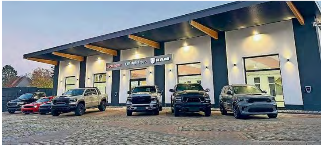
Das KWAutohaus ist das Mekka für Fans von Muscle Cars.

Das Autohaus der besonderen Art bietet die einzigartige Möglichkeit, diese beeindruckenden Fahrzeuge aus nächster Nähe zu betrachten und diese Unikate auf Reifen zu bewundern und sich an das Steuer eines DODGE Challenge