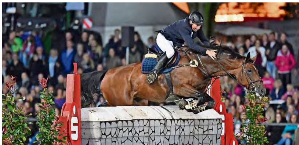
Das Mächtigkeitsspringen unter Flutlicht war seit 1954 ein Zuschauerermagnet am Samstagabend. Nun ist es Geschichte.

> auf den ersten Ritt - doch die Reiter entschieden sich zum Tierwohl gegen die dritte Runde und teilten sich stattdessen den Sieg und das Preisgeld. Ein plötzliches Ende des Höhepunktes, das dazu führte, dass die Zuschauer teils etwas enttäuscht den Heimweg antraten. Andere wiederum wendeten sich früher als geplant dem Tresen bei der Turnierparty zu. Das war nicht immer so. „Die Leute sprechen mich noch heute darauf an, was vor 25 Jahren war“, berichtet der heute 62-jährige Peper. „Früher war ein Sieg im Mächtigkeitsspringen mehr wert, als den Großen Preis zu gewinnen -