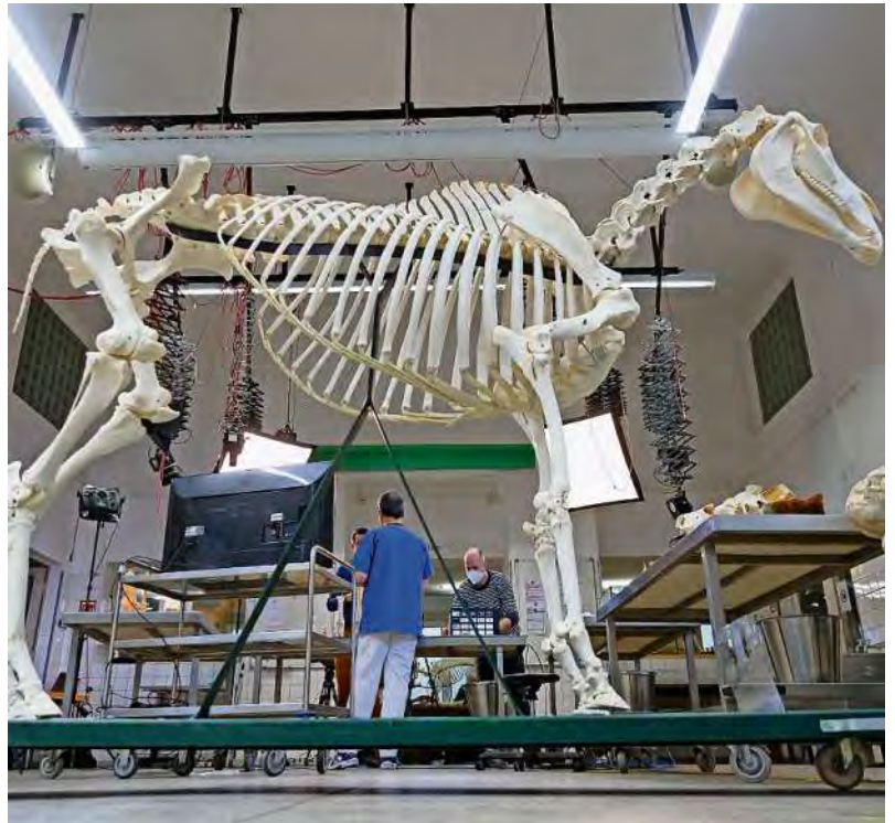
Durch die Züchtung sollen bei einigen Pferden die Halswirbel C6 und C7, nur noch unzureichend ausgebildet sein.

Für ihn steht allerdings etwas anderes im Vordergrund. Dass die alten Werte der Pferdezucht wie Körperbau, Korrektheit und Fundament wieder wichtiger werden. „In der Modernisierung der Dressurpferdezucht sind wir mittlerweile weit genug gegangen, was Vergrößerung des Bewegungsablaufes angeht. Ich glaube, wir müssen da jetzt mal eine gewisse Konditionierung machen“, betont der Hemmoorer. Und er muss es wissen. Die Hengststation Pape ist ein