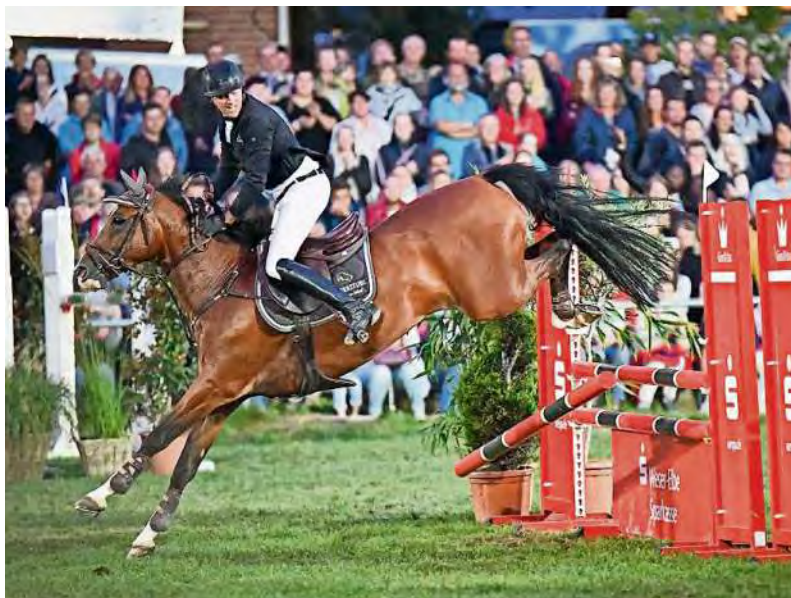
Das Zweikampfspringen am Freitagabend kehrt zurück.

Doch nicht nur in der Dressur warten Neuerungen. Auch im Springparcours bekommen die Zuschauer neue Prüfungen zu sehen. Zudem kehrt das beliebte Zweikampfspringen am Freitagabend zurück. Erstmals zu sehen sein wird das Speedderby. Ein S-Springen, bei dem Fehler mit Zeitpunkten bestraft werden. In dieser Prüfung wird